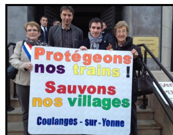
Délégation au Conseil Régional de Bourgogne

Merci à tous ceux qui nous ont soutenus dans cette démarche, notamment par la signature de la pétition pour laquelle plus de 500 signatures ont été recueillies sur le secteur.