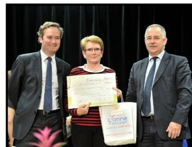
Remise du prix départemental le 28 novembre 2014 à Migennes

Ce jury a également attribué à notre commune le 1 er prix départemental du fleurissement des communes de moins de 1 000 habitants récompensant ses efforts pour l'embellissement du village. Félicitations à toutes et tous.